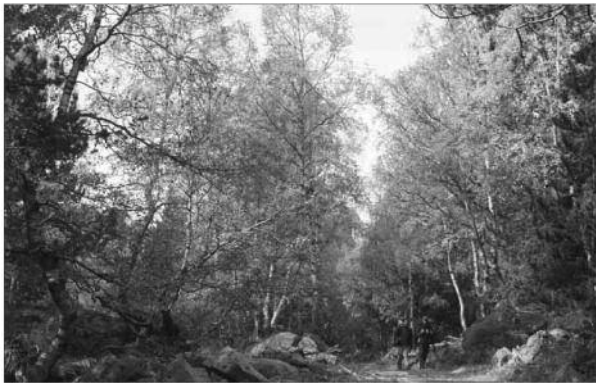
Excursionistes al Parc Nacional d'Aiguestortes i Estany de Sant Maurici

La Universitat Catalana d'Estiu (UCE) ha fet durant aquest agost una reflexió sobre l'estat de la qüestió. Responsables de medi ambient, energia i meteorologia d'Andorra van presentar diverses ponències que van posar sobre la taula els principals efectes i l'aparició ja d'una consciència social del tema: el 68% dels ciutadans del Principat ja ho consideren un problema molt greu que pot afectar no només l'entorn natural, sinó l'economia i, per tant, la disminució de les zones esportives, principalment el turisme, i Andorra davant la viabilitat dels cultius de vinya gràcies a la major insolació i temperatura. El líder del grup