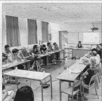
Una de les ponències andorranes de l'UCE.