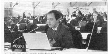
El 20 d'agost s'obrirà l'exposició "El canvi climàtic" a Prada de Conflent.