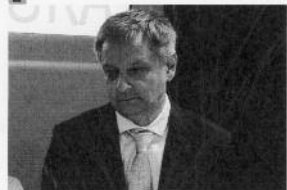
El ministre d'Afers Exteriors, Gilbert Saboya.

08/08/2016 ANA - Agència de Notícies Andorrana