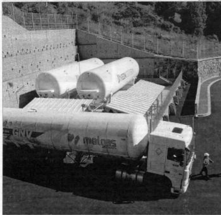
PRIMERA CÀRREGA DE GAS LIQUAT A UN CAMIÓ A LA PLANTA DE COGENERACIÓ

La diferència de preu entre els dos països també varia segons l'any, va apuntar Moles. "Els preus entre Espanya i França són